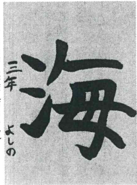
アテネ日本人学校 (ギリシャ)

僕が今、夢中になっているのはサーフィンだ。今、僕はアメリカのハワイ州、ハワイ島に住んでいる。僕の家から波があるビーチまで、車で十五分だ。