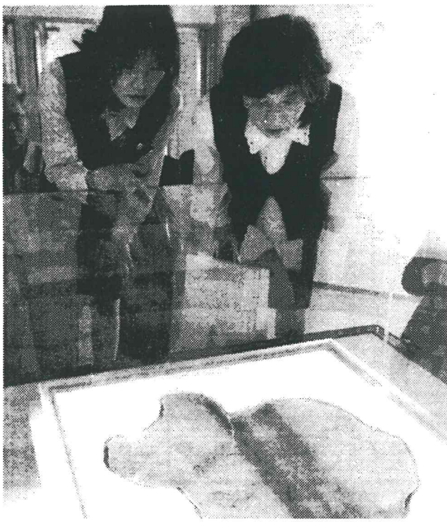
奈良文化財研究所飛鳥資料館で、村民に初公開された壁画「白虎」11日午前、奈良県明日香村。共同

保存のためはぎ取られた四神図「白虎」が十一日、奈良文化財研究所飛鳥資料館（同村）で村民に初めて公開された。