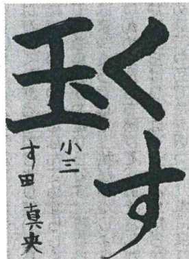
ソウル日本人学校 (大韓民国)

僕が最初に買ったボードは人に当たっても痛くない八フィートのボードだ。しかし、大きな波の衝撃波を受けているうちに、ある日、真つ二つに割れてしまった。一番目に買ったボードは、同じ種類で、六・四フィートのものだ。始めてから三年が経ちコントロールがいたので、今度は人に当たったら痛いショートボードを買った。ターンの切れ味が違う。 波があるビーチが、家から車で十五分とはサーファーにとって楽園だ。サーフィンはこんなに楽しいのに、なぜ僕はサーフィンを日本でやっていたのかわからなかったのかと不思議に思う。サーフィンをしていると、夢中になり時間がすごく早く進む。